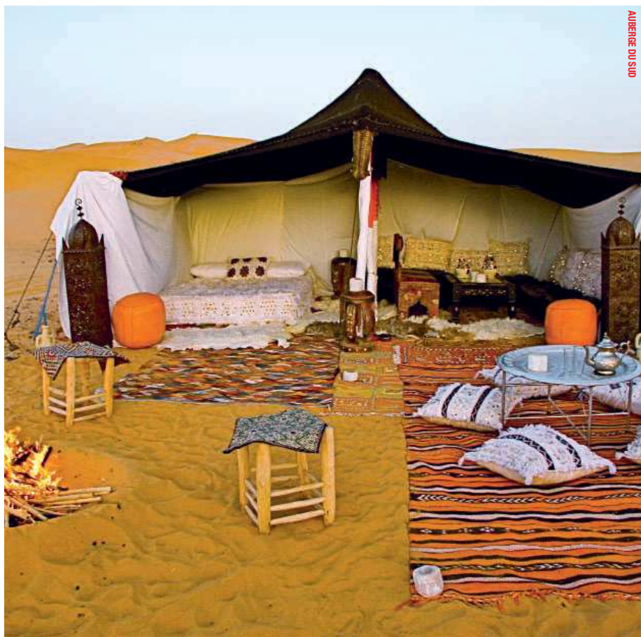
AUBERGE DU SUD